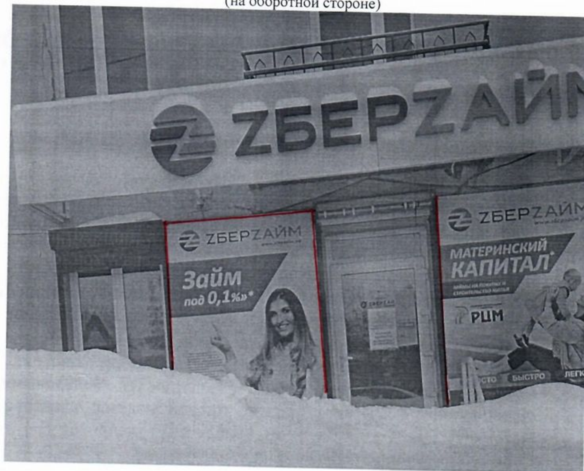
Фото рекламной конструкции (на оборотной стороне)

* В соответствии со ст. 14.37. КоАП установка и (или) эксплуатация рекламной конструкции без предусмотренного законодательством разрешения на ее установку и эксплуатацию влекут наложение административного штрафа: