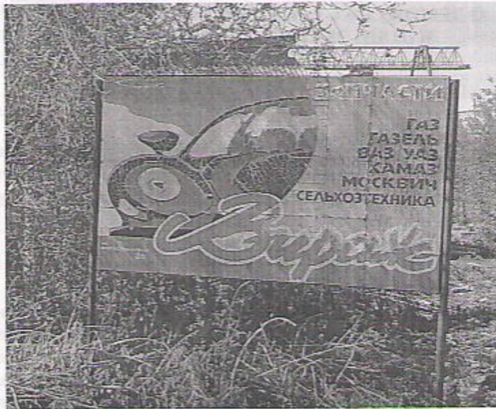
Фото рекламной конструкции (на оборотной стороне)

* В соответствии со ст. 14.37. КоАП установка и (или) эксплуатация рекламной конструкции без предусмотренного законодательством разрешения на ее установку и эксплуатацию влекут наложение административного штрафа: