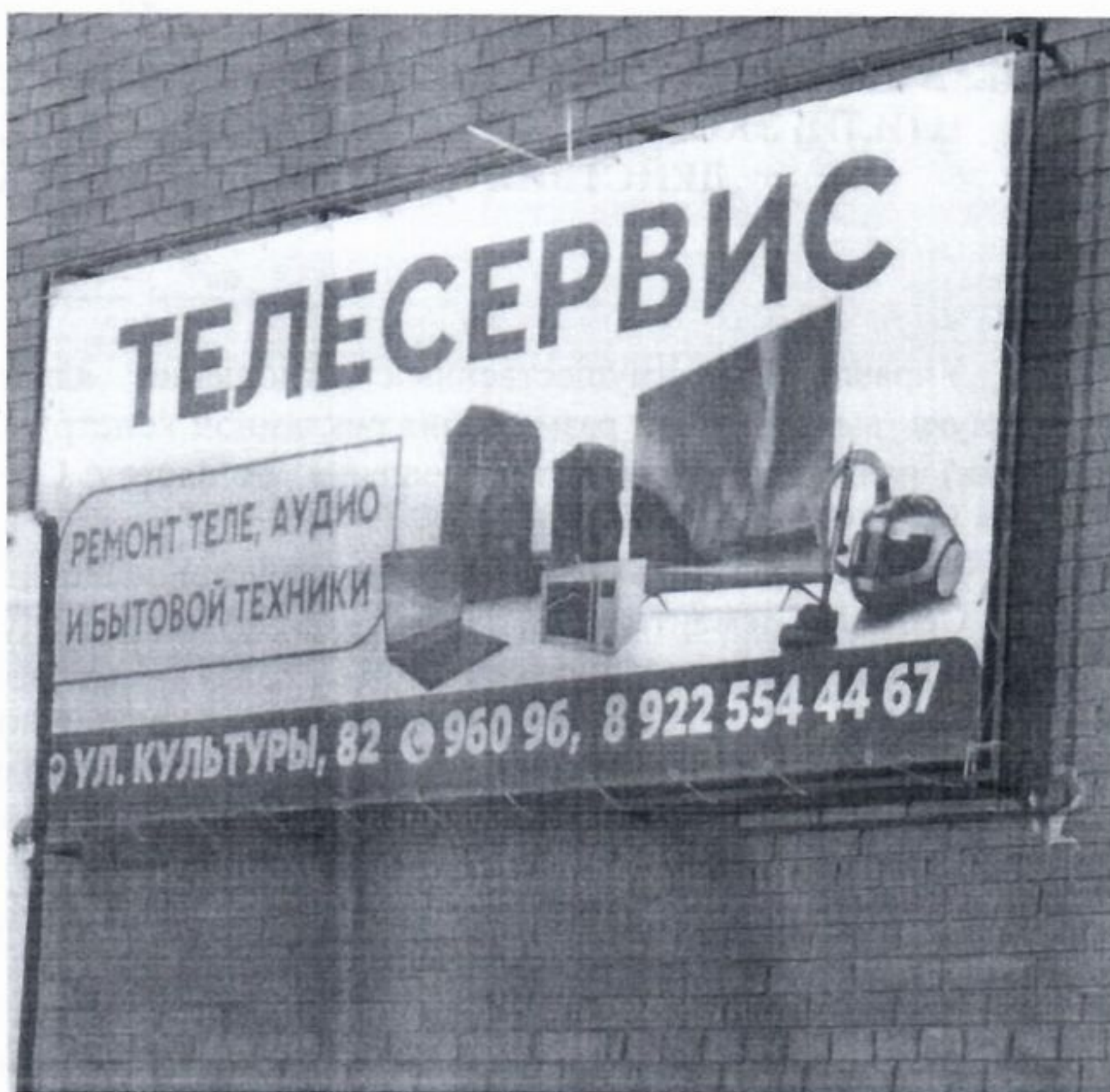
Фото рекламной конструкции (на оборотной стороне)

* В соответствии со ст. 14.37. КоАП установка и (или) эксплуатация рекламной конструкции без предусмотренного законодательством разрешения на ее установку и эксплуатацию влекут наложение административного штрафа: